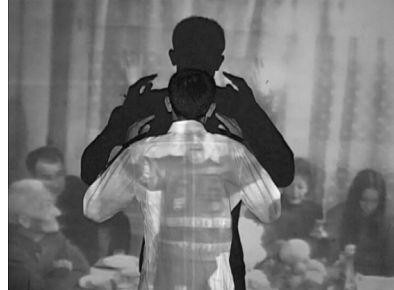
Անհանգստացնող ժառանգություն Էռնեստ Ոսկանյան

Մորական տատիկը անցկում ու հավատարիմ Ստալինիստ է, ով մինչ օրս հավատում և պաշտպանում է կոմունիզմի հայացքները: Նա սուբյեկտիվ է, քանի որ շարունակում է իր թռանը սովորեցնել կոմունիզմի իրական էությունը իր սեփական փորձառության վրա հիմնված գիտելիքի միջոցով՝ որպես կոմունիստ, որն աշխատել է Մինիստրության ապարատում: